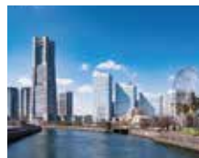
みなとみらいまでも約30分